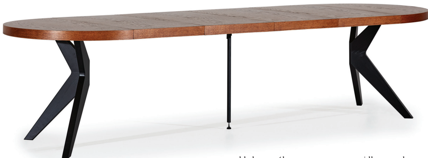
przykładowy stół z zamontowaną prawidłowo podporą

Większość modeli z dwiema i więcej wkładkami posiadają tzw. wsporniki montowane do prowadnicy stołu. Zadaniem podpór jest stabilizowanie rozłożonego stołu i utrzymywanie blatu w poziomie. Zastosowanie wspornika gwarantuje odpowiednią pozycję stołu i nieodkształcanie się elementów konstrukcyjnych. Nie stosowanie podpory może spowodować trwałe uszkodzenia konstrukcji, których nie obejmuje gwarancja.